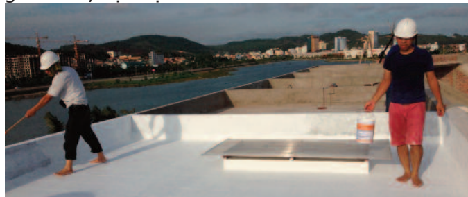
Thi công sơn lớp sơn nanocompozit acrylic/R-TiO 2