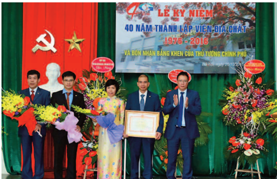
Lễ trao Bằng khen của Thủ tướng Chính Phủ cho tập thể Viện Địa chất

N gày 26/10/2016 tại Hà Nội, Viện Địa chất tổ chức trọng thể Lễ kỷ niệm 40 năm thành lập (1976-2016) và đón nhận Bằng khen của Thủ tướng Chính phủ, cùng các Huân chương lao động hạng Nhì, hạng Ba) cho các cán bộ khoa học và nguyên lãnh đạo của Viện Địa chất.