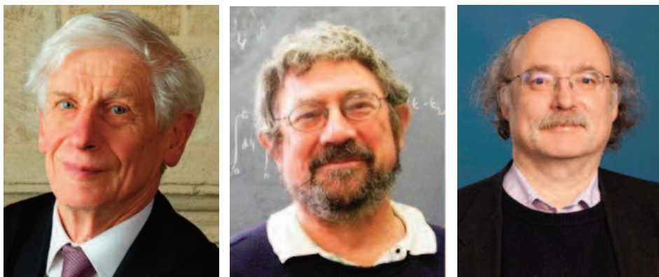
Ba nhà khoa học đoạt giải Nobel Vật lý 2016 (Từ trái qua phải: D. Thouless, M. Kosterlitz, D. Haldane)

Hội nghị khoa học tăng cường năng lực quản lý khoa học và công nghệ của Viện Hàn lâm KHCNVN