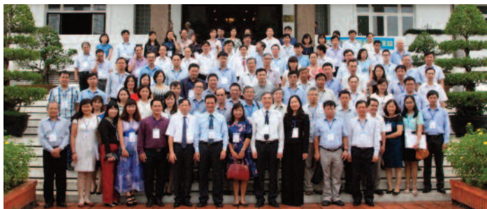
Các đại biểu tham dự Hội nghị chụp ảnh kỷ niệm